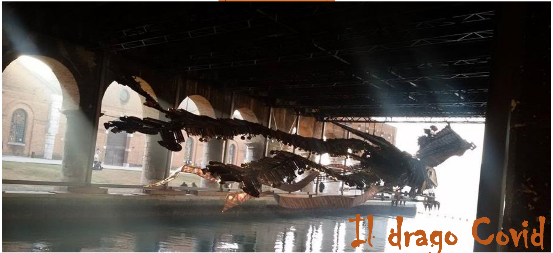
Il drago Covid