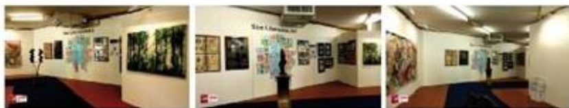
ARTE FIERA DOLOMITI 2019, i lavori degli alunni delle scuole elementari e medie del quartiere.