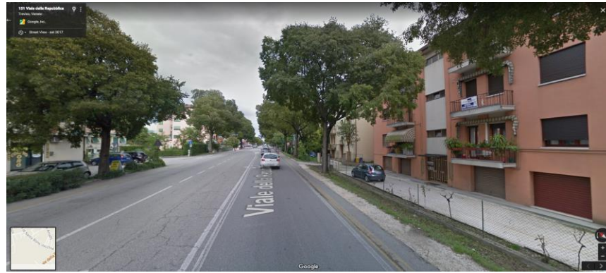
Pista ciclabile vicino alla strada