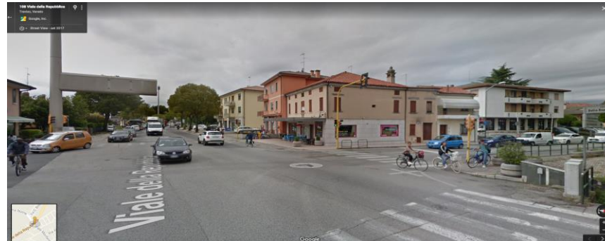
Presenza di negozi